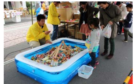
たくさん釣れるかな～??