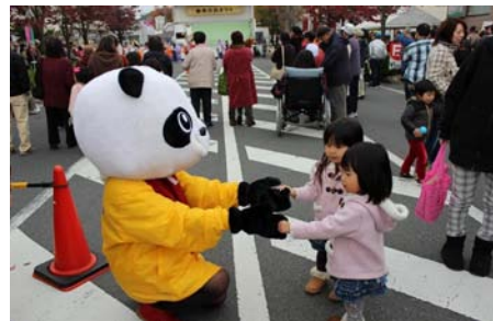
顔だけパンダさん(笑) 意外と子供に人気なんですよ☆