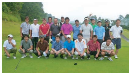
OBの皆さんと楽しくプレーできました！