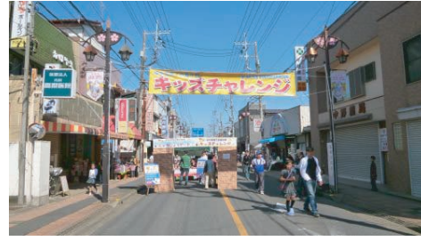
キッズチャレンジはじまり〜♪