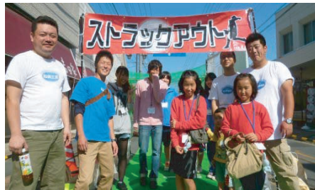
↑ストラックアウトの皆さんです。 キッズサポーターもいます♪