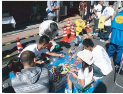
↑お菓子釣りの皆さんです。 ←いつばい釣れたかな?