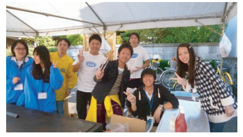
↑サッテリアの皆さんです。 ←サッテリア名物ホットドック!?

取り組んでくれました。なかなか販売数が伸びず苦勞はしましたが、みんなで協力しあい、完売することが出来ました。当日サボっていたのは僕だけです。ごめんなさい。みなさんのご協力に感謝いたします。ありがとうございました。