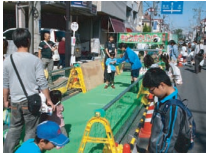
↑キックボーリングの皆さんです。 ←何本倒せたかな?