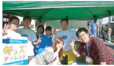
受付の皆さんです!