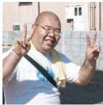
祭 員長 葉有 委員 葉久保 親睦 大久保 親睦 大久保

のべ800人を越えるたくさんの子供たちのキラキラ輝いてくれた笑顔があふれる楽しい一日を過ごすことができました。そして幸手商業生・日本保健医療大学生ボランティアをはじめ、ご協力頂きましたすべての皆様に感謝感謝です。ありがとうございました。あ〜楽しかった!