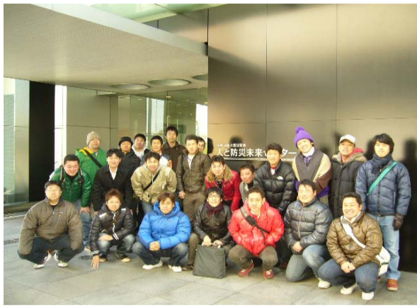
人と未来防災センターにて