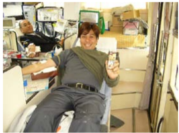
献血頑張ってます!!