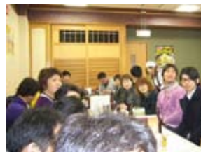
その後、商店街の皆様と交流

翌日、次の視察地は御園橋801商店街(みそのぼしはちまるいち)です。京都駅よりバスにて約4分のところにあり、いくつもの偶然が重なって生まれた、キモカワなゆるキャラ『やおいちゃん』を中心に商店街の活性化・発展・町おこしをすすめている、情熱と活気を持った商店街です。 商店街を視察し、やおいちゃんのキグルミ(でかい・きもい・かわい?)に遭遇、やおいちゃんグッズを拝見し、研修場所へと移動、これまでの商店街の活動内容の説明と自主制作DVDを見させていただきました。その後、私たち青年部員も活発な質疑応答を行いました。 研修終了後の懇親会では、和気藹々と楽しい時を過ごすことができた。大変勉強になり、有意義な時間を過ごすことができ、早速わが幸手市も参考にさせていただきます。 今回、視察研修旅行に初めて参加しましたが、大変勉強になった旅となりました。