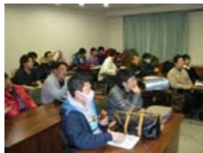
コミュニティーセンター嵯峨野手話研修センターにて研修中