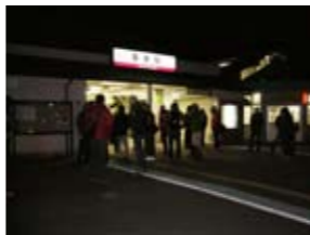
早朝の幸手駅 参加できない部員の見送りも 青年部の結束の証