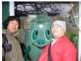
噂の「やおいちゃん」と一枚