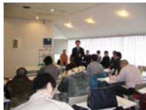
801商店街の取り組みを視察