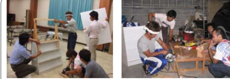
精意作成中 水道屋が大工になり、床屋はシェービングクリームにペンキを塗り、ラーメン屋は包丁をノコギリに持ち替え、眼鏡屋は眼鏡の数倍の重さの材料を運び、そして葬儀屋はお菓子の山を供えていった。このように連日、深夜までの作業が続きました。

研修委員会では、部員の皆様に手話を知って頂きたい、触れて頂きたいと考えています。そこで青年部新聞への掲載をはじめ、今年6月には幸手市聴覚障害者協会ならびに幸手手話サークルの方々のご協力のもとに、手話講演会を開催することができました。そして、今回は幸手市民の皆様にも手話に触れて頂きたいと思ひ、市内11箇所に手話PRボードの設置をいたします。ボードのコピーは『ありがとう』です。同時に青年部新聞のコラム「Are You Sure(手話)」に掲載した内容から挨拶を中心とした制作したリーフレットを配布いたします。