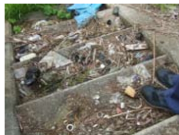
階段に散乱するゴミ