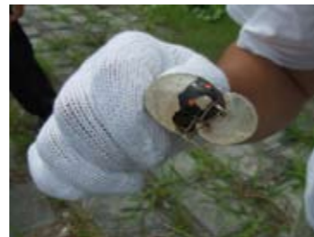
釣り糸や針が付いたままのルアーも!!