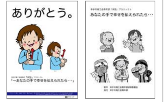
このようなPRボードとリーフレットが設置されます