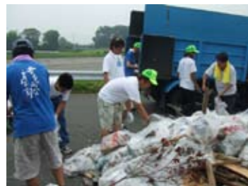
集まったゴミを分別しながら収集しました