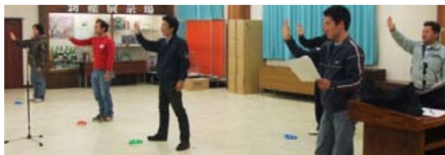
青年部内手話講習の様子

師としてお迎えし、手話と聴覚障害者の歩み、手話を用いたゲームなど、終始和やかな雰囲気の中で行われました。