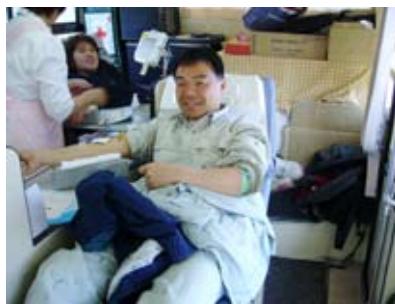
一人でも多くの命が救われますよう...

2月14日（木）愛のバレンタインではなく愛の献血に、一般参加者、青年部OB、青年部の方お忙しい北風の強い寒い中、多数の参加本当にありがとうございます。献血結果をお知らせします。