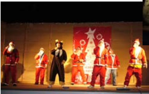
青年部による手話歌