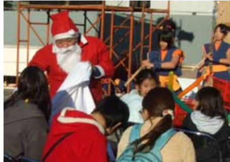
和太鼓保存会栗原会長サンタで登場