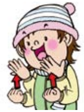
応用編「あけまして、おめでとう」