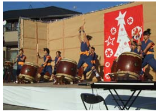
和太鼓保存会優雅に舞う

「クリスマスイルミネーション2007」に参加協力を頂いた方々に心より御礼申し上げます。 和太鼓保存会様、さくら幼稚園様、白百合幼稚園様、歌声サークルゴンドラ様、 ふれあいおもちゃ館遊様、野本商店様、小山屋酒店様、ローズハウス様、幸手学園様、 へそづくり応援団様