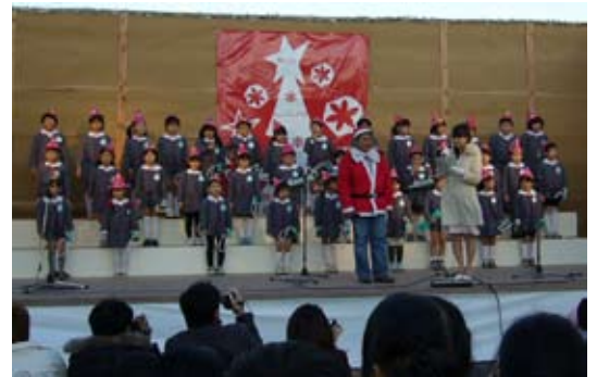
かわいい歌声 白百合幼稚園合唱