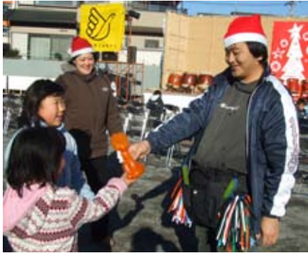
大人気!バルーンアート