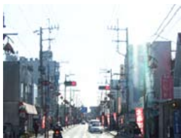
平成20年現在、同じ場所から