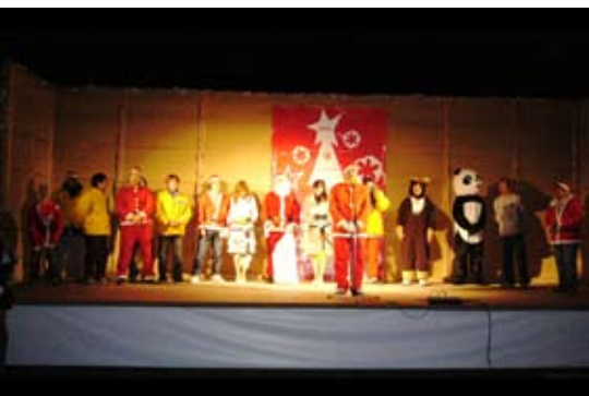
感動のフィナーレ