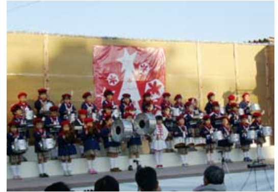
すてきな演奏でした さくら幼稚園鼓笛隊