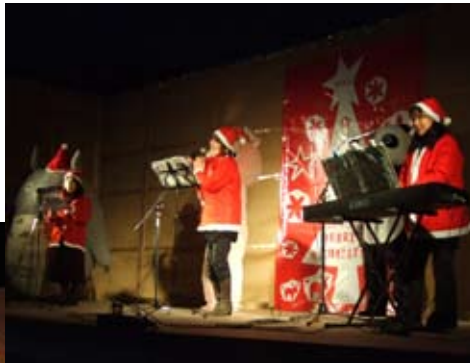
美しいハーモニー 歌声サークルゴンドラ