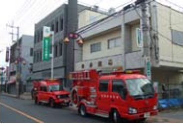
平成19年現在、同じ場所から