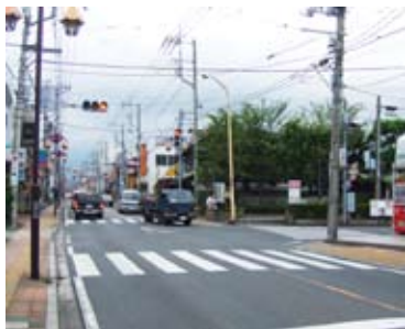
平成19年現在、同じ場所から

明治、大正、昭和と時代を超えても、当時の「おらが街のおまわりさん」の榮譽と誇りを胸に持って、平成の時代の今になっても地域の人は、中三丁目の交差点から国道四号線までの間を親しみを込めて「警察横町」と呼んでいる。