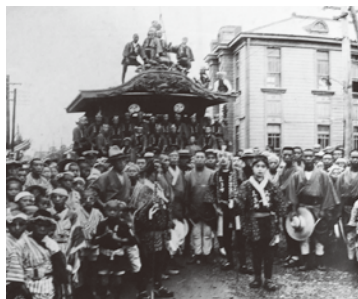
昭和5年頃、八坂祭りの様子