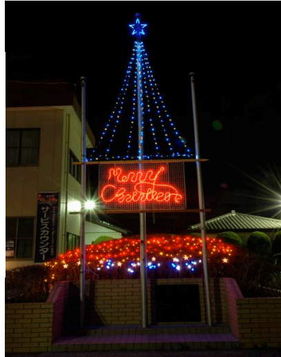
(商工会の掲揚台もこんな感じ。)

この企画は単にコンテストというだけでなく、幸手市に住む地域住民の皆様との積極的なコミュニケーションをとる事の出来る大きなイベントであったと感じております。